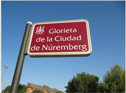
Nürnberger Platz in Córdoba